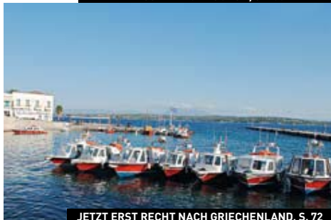
JETZT ERST RECHT NACH GRIECHENLAND, S. 72