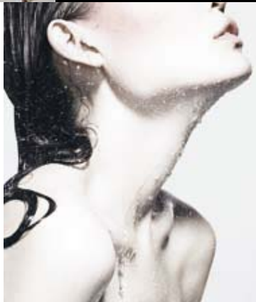
WASSER MACHT SCHÖN, S. 100