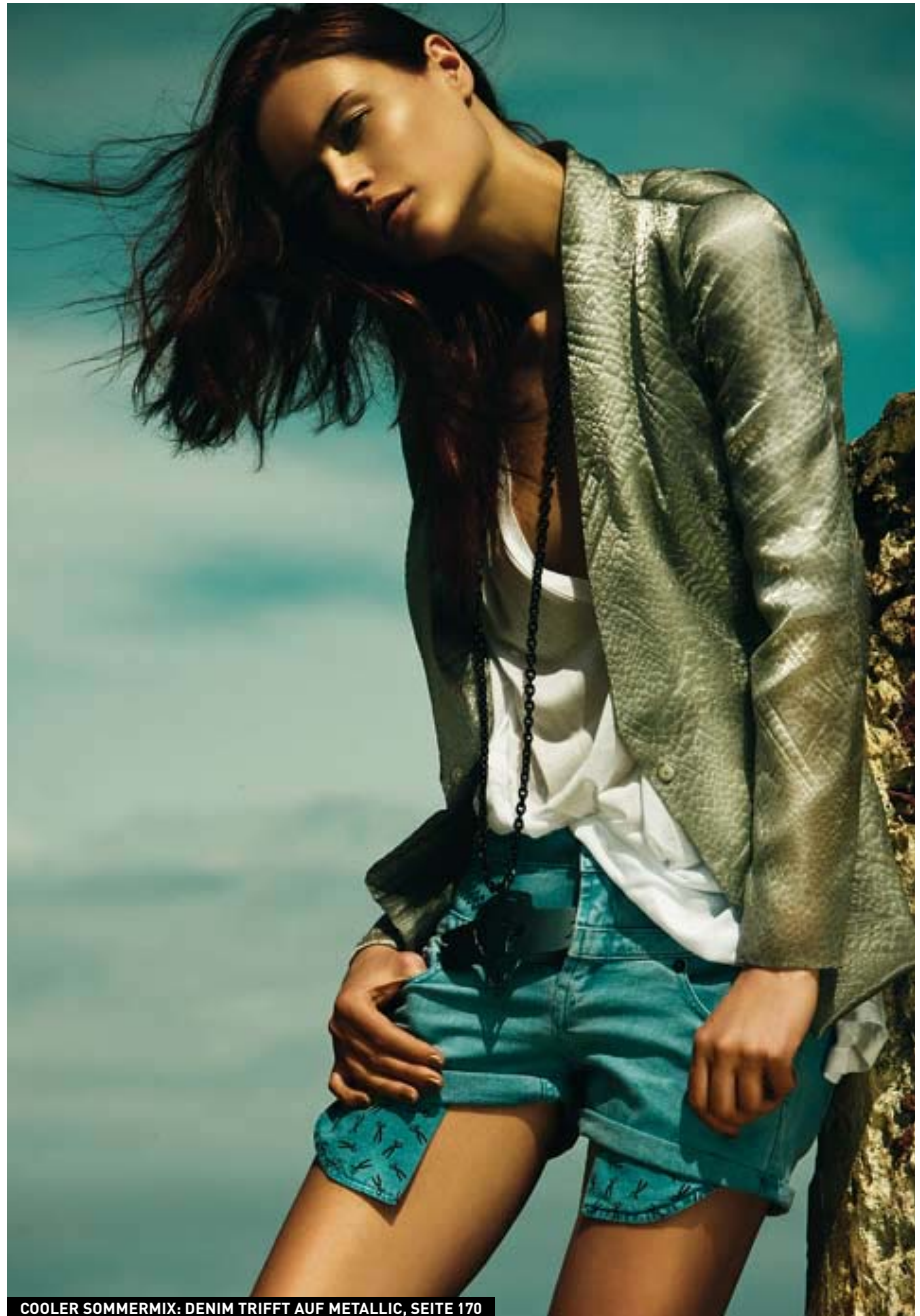
COOLER SOMMERMIX: DENIM TRIFFT AUF METALLIC, SEITE 170

UNSERE TITELTHEMEN SIND IN PURPUR MARKIERT