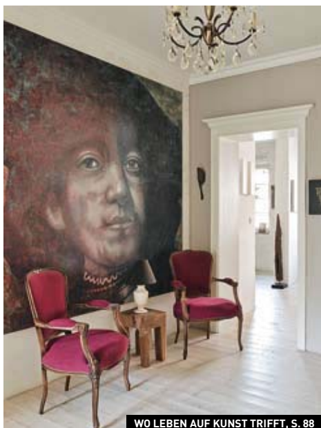
WO LEBEN AUF KUNST TRIFFT, S. 88