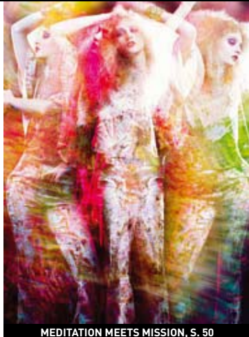
MEDITATION MEETS MISSION, S. 50